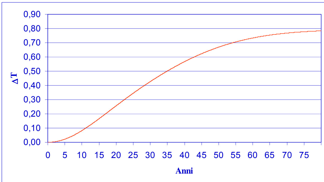
Figura 3: variazione di temperatura prodotta dalla posa in opera di circa 10 milioni di km 2 di superficie riflettente (coefficiente di riflessione nello spettro solare pari a 0,9).

necessaria a compensare l'effetto dell'immissione in atmosfera di una tonnellata di CO 2 : S = 19 \text{ m}^2/\text{tCO}_2 .