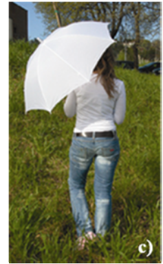
Figura 4: a) ipotesi di realizzazione di saline in siti a basso pregio ambientale, b) esempio di trattamento sbiancante delle infrastrutture di trasporto, c) esempio di impiego di oggettistica di colore bianco.